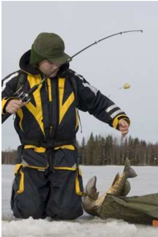
Upp kom den med en jåkla fart.