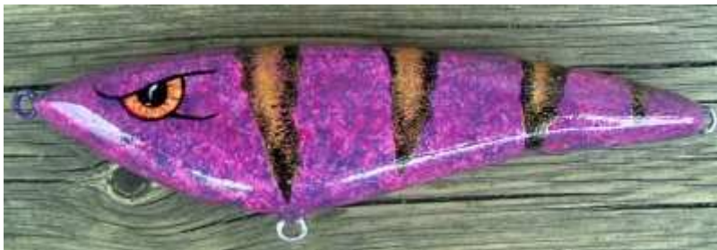
Lord of the Midnight, tillverkad av Jaraal.