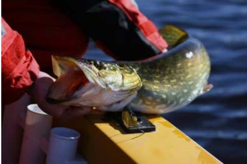
Këff inleder med en liten gädda.