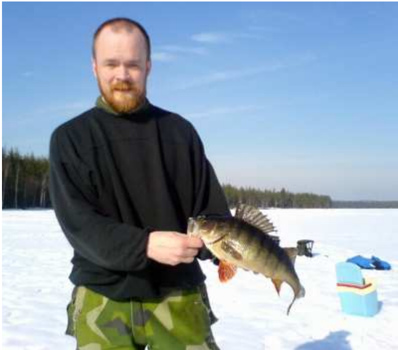
Rödingen med dagens största på 1,1 kg.