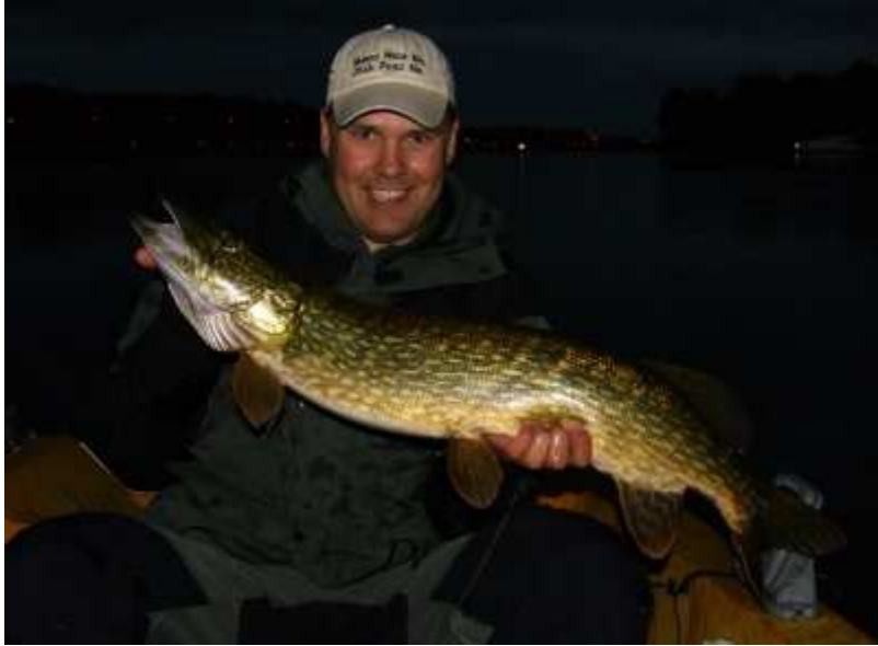
Sen fångade jag en stor gädda.