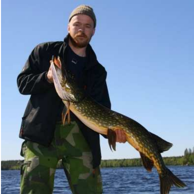
Gäddan var en riktig kätte på 7,5 kg och 107 cm, nytt personligt för Rödingen.