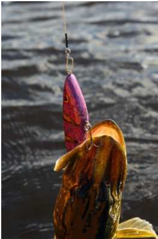
Robert kontrar med en lite större gädda.