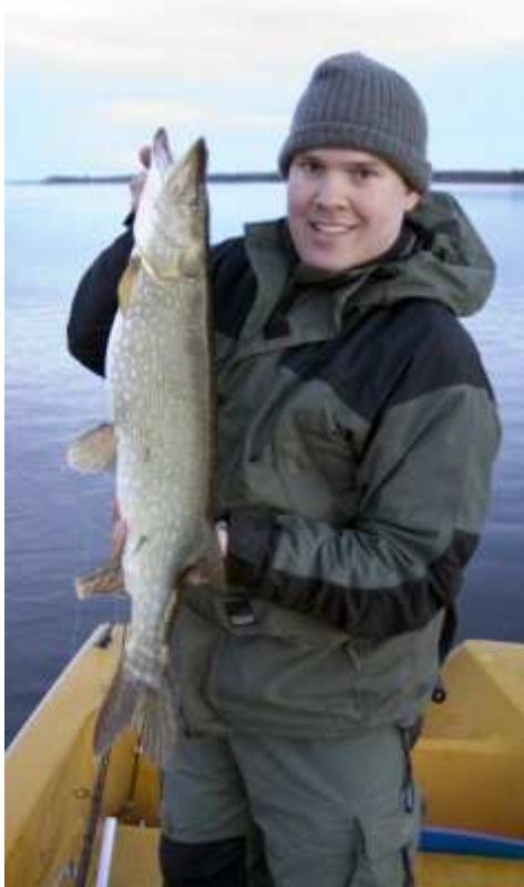
En romfylld 5-kilos också tagen på mitt Jaraal-bete.