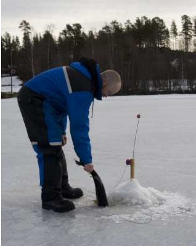
Plums tillbaka i baljan igen.