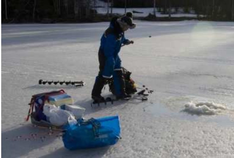
Rödingen apterat sina angeldon.