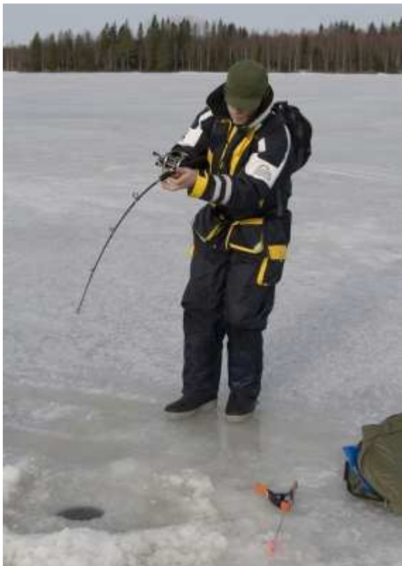
Henke drar i ett mothugg.